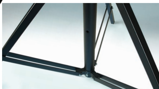
Pattes à double traverse