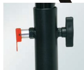
Molette de rattrapage de jeu et mât embouti pour un guidage parfait et goupille de sécurité