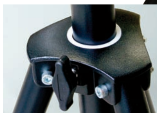
Chariot en aluminium coulé avec molette de serrage sur cale polyamide et bague téflon